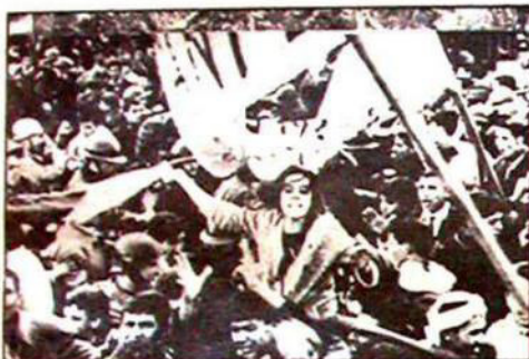
"La batalla de Argel" de Guido Pontecorvo

RECOMANAM: "LA BATALLA DE ARGEL" de Guido Pontecorvo; i "LAS ULTIMAS NOCHES DE BORIS GRUSHENKO" de Woody Allen.