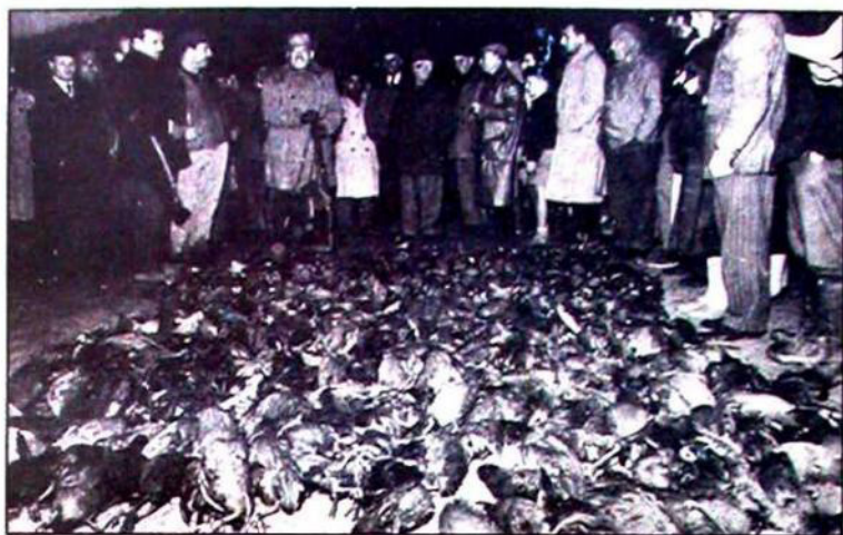
Mallorca seu de l'escopeta Nacional"